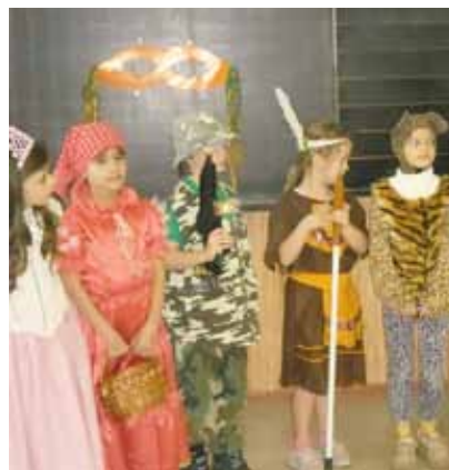
Az alsósok farsangi mulatsága

reti levelezős versenyen 6. osztályos leányainkból alkotott csapat sikeresen szerepelt. Néhány ponton múlt csak, hogy lemaradtak a végső megmérettésről.