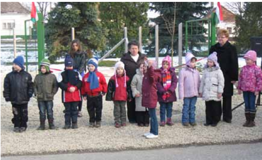
Az ovisok is kitétek magukért