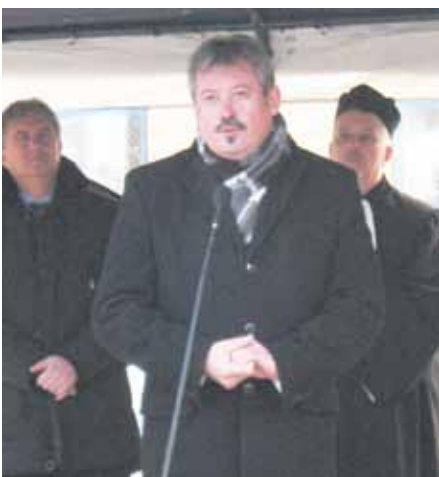
Németh Zsolt államtitkár ünnepi beszéddel készült, majd ő adta át az új létesítményt