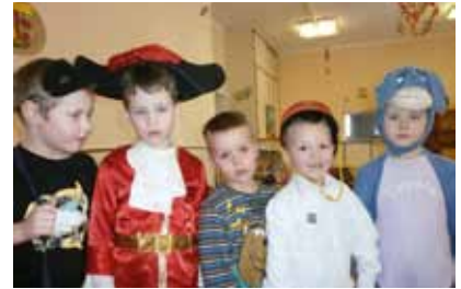
Ovis kisfiúk a házi farsangon

„Májusi vasárnap illatos reggele, drága jó anyukám virágos ünnepe.”