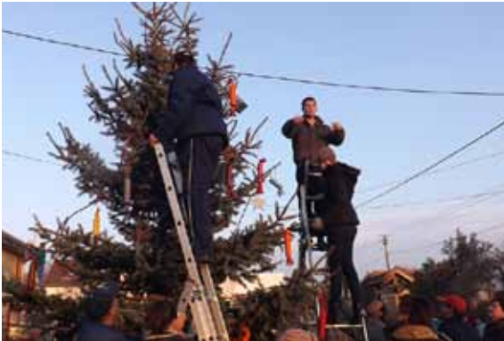
A falu karácsonyfájának díszítéséből mindenki kivette a maga részét