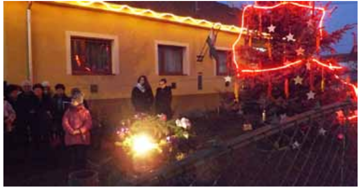
Advent első hétvégéjén kigyúltak az ünnepi fények...