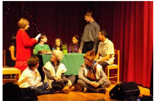
Az iskolások is színvonalas produkcióval rukkoltak elő