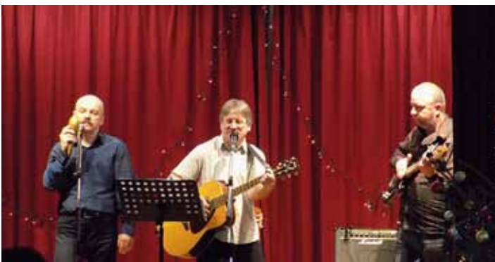
A Tarisznyások ünnephez illő dalokkal készültek