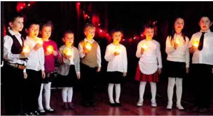
Az óvodások gyertyás táncot adtak elő a karácsonyvárón