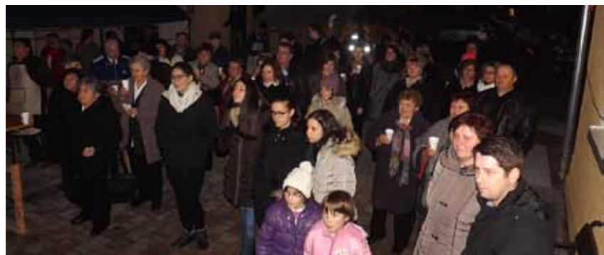
A tavalyi év képei sokak arcára mosolyt csaltak