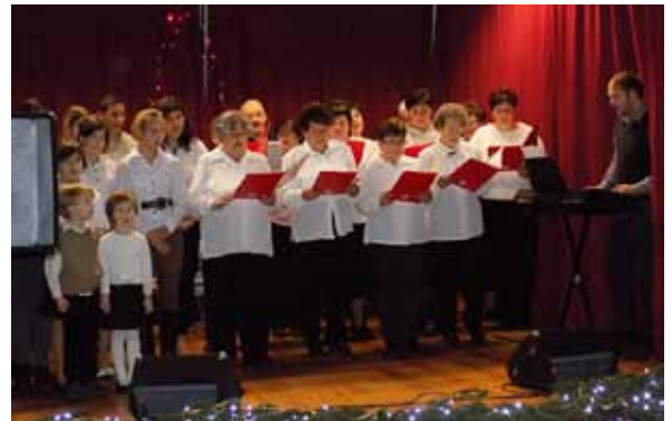
A műsor végén mindenki együtt énekelt