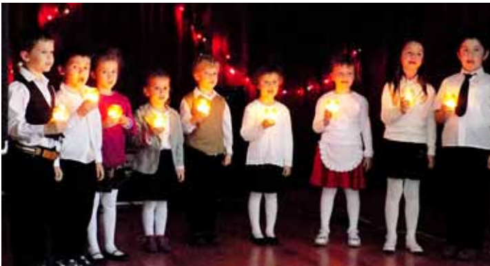
Az óvodások gyertyás táncot adtak elő a karácsonyvárón