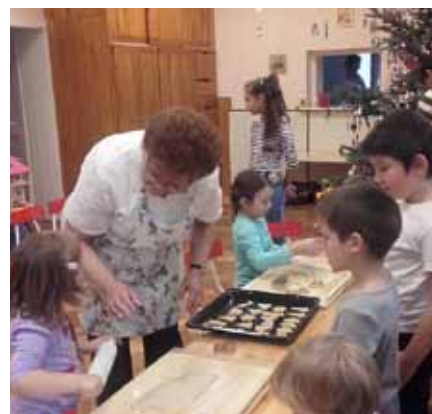
A mézeskalácsok sütése nagy sikert aratott a gyermekek körében

A hagyományoknak megfelelően idén is műsorral készültünk a falu karácsonyváros ünnepségére, amely meghitt, bensőséges hangulatot árasztott.