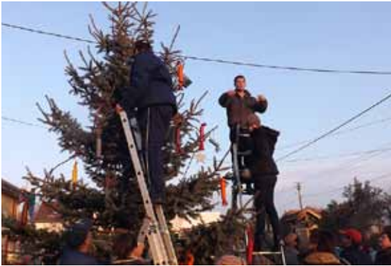
A falu karácsonyfájának díszítéséből mindenki kivette a maga részét