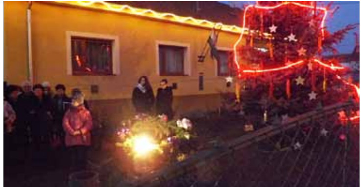
Advent első hétvégéjén kigyúltak az ünnepi fények...